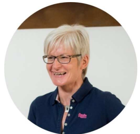
lic. oec. publ. et MBA Dipl. Mental-Coach, Coach Matrix Inform

In meiner jahrelangen Tätigkeit als Führungskraft, Coach und Trainerin lebe ich meine Leidenschaft, Menschen auf ihrem Lebensweg zu begleiten schon seit über 2 Jahrzehnten. Die Auseinandersetzung mit mir selbst, die Bereitschaft, hinzuschauen und der Mut, mich meinen eigenen Barrieren zu stellen, sind meine ständigen Begleiter und erlauben mir, Schritt für Schritt zu wachsen. Die Reise zu uns selbst ist die spannendste und dankbarste, die wir alle beschreiten dürfen. Sie entfesselt die unglaubliche Kraft, Energie und die Lebensfreude, die in uns allen steckt.